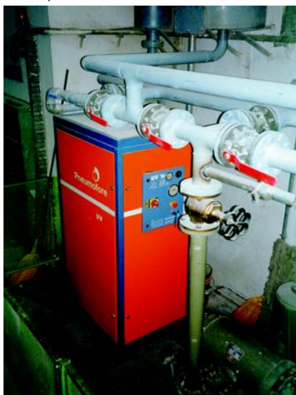
Abb. 2 - Pneumofore UV16 Vakuumpumpe bei Italpasta - Turin

Die Pastaherstellung entsteht aus einer Mischung aus Mehl und 15%