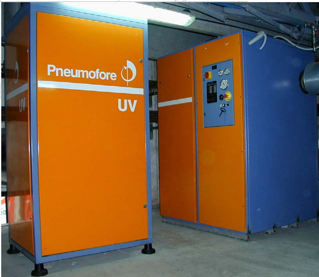
Vakuumanlage in grösseren Teigwaren Fabrik 1 UV16 (alte Ausführung) und 1 UV16 (neue Ausführung), je 1000 m 3 /Std und 22 kW, bei Pastificio L. Garofalo in Gargnano bei Neapel.

Artikel veröffentlicht in Drucklufttechnik 5/6-2000