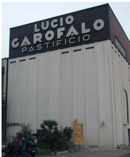
Abb. 5 - Pastificio Garofalo in Gragnano / Napoli

Pneumofore UV Pumpen werden mit sämtlichen Komponenten in schallgedämpfter Kabine und anschlussbereit (mit Ölfüllung) geliefert. Luftkühlung ist nicht nur wegen des Umweltschutzes aktuell, auch wegen den Wasserpreisen, die auch für die Industrie zunehmen werden. Außerdem erleichtert sie wesentlich den thermostatischen Betrieb der Pumpe. Die UV Pumpen, entstanden aus den langjährigen Pneumofore Kompressoren (8 bar) mit Öleinspitzkühlung, sind wie diese langlebig, bedürfen wenige bzw. keine Ersatzteile, verlangen den Ölwechsel nach 4000 Betriebsstunden. Der Erfolg der UV Pumpen ist begründet durch ihr unschlagbarer Zuverlässigkeitsgrad und der Lösung mit Öldampfausstoß: Pneumofore bietet heute schon die Umweltbedingungen von morgen.