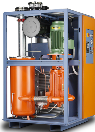
Vakuumpumpe Pneumofore UV16

Bei diesen Vorteilen sollte es nicht schwer sein, einen Kunden zu überzeugen, seine Flüssigkeitsringpumpen durch Drehschieberpumpen zu ersetzen. So einfach ist es allerdings nicht, wie Santoro erläutert: „Die Schwierigkeit liegt in der Generation. Junge Unternehmer rüsten leichter um, sie sehen das lockerer als Unternehmer der älteren Generation. Es ist schwer, einen Familienbetrieb zu überzeugen, die Technologie zu ändern, wenn sie seit Jahren Wasserringpumpen benutzen, die auch immer ihren Dienst getan haben. In vielen Fällen sind sie zufrieden, weil sie die Alternative der Drehschieberpumpen nicht kennen, und es ist schwer, alle Vorteile rein aufs Wort zu glauben. Außerdem sind nicht alle Drehschieberpumpen gleich. Pneumofore verwendet nur Schieber aus Aluminiumlegierung, die praktisch unzerstörbar sind, und nicht aus Kunststoffmaterial, die dem Verschleiß unterliegen. Die Pumpen von Pneumofore können ganzjährig 24 Stunden am Tag arbeiten und dieselbe Vakuumproduktion wie am ersten Tag garantieren, wobei sie nur eine gewöhnliche Wartung mit Ölwechsel und Filteraustausch erfordern.“